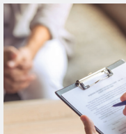
Projet individualisé de soins

Un processus de rétablissement qui passe par la réhabilitation psychosociale